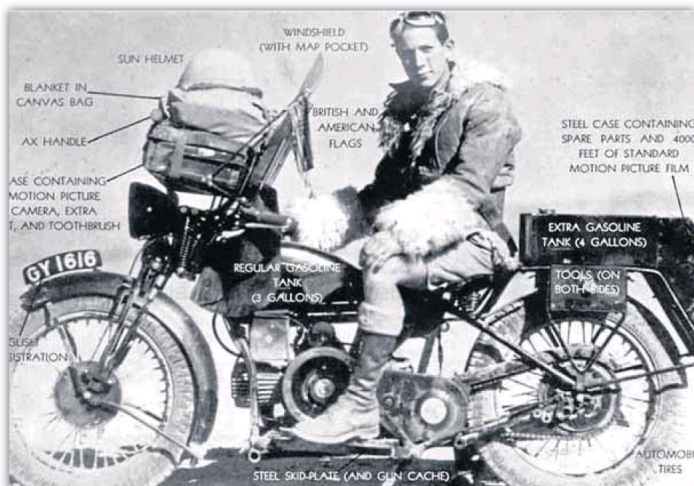
Una de las imágenes que se pueden ver en el libro 'Caravana de uno'.